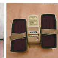
イージーウォーク