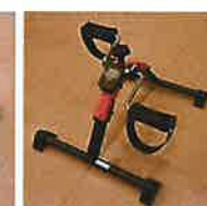
ペダルエクサイザー